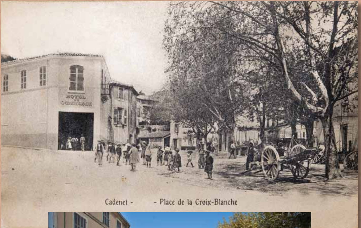
Cadenet - - Place de la Croix-Blanche