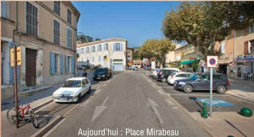
Aujourd'hui : Place Mirabeau