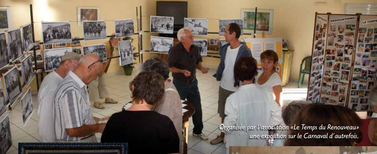
Organisée par l'association «Le Temps du Renouveau» une exposition sur le Carnaval d'autrefois.